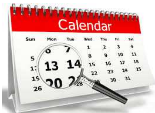
Illustrazione e consegna del report in azienda da parte del valutatore entro 5 giorni lavorativi dall'effettuazione del test.